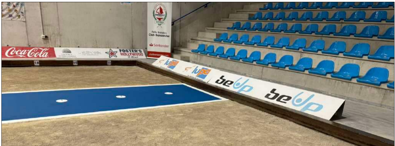
Placa del tiro de la bolera con la nueva capa de pintura.