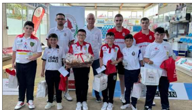
Entrega de premios de la categoría alevín.