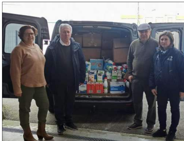
Alimentos recogidos en la campaña la "Gran Recogida de Alimentos" promovida por la Peña Bolística Club Bansander y el personal del pabellón Uco Lastra de Cueto. A la derecha, entrega de los alimentos con el responsable del Banco de Alimentos Infantiles de Cantabria.

Terminó la cuarta edición de la gran recogida solidaria de alimentos llevada a cabo un año más en el pabellón Uco Lastra organizado por la Peña Bolística Club Bansander junto con el personal del pabellón Uno Lastra y con la colaboración de los equipos que utilizan esta instalación.