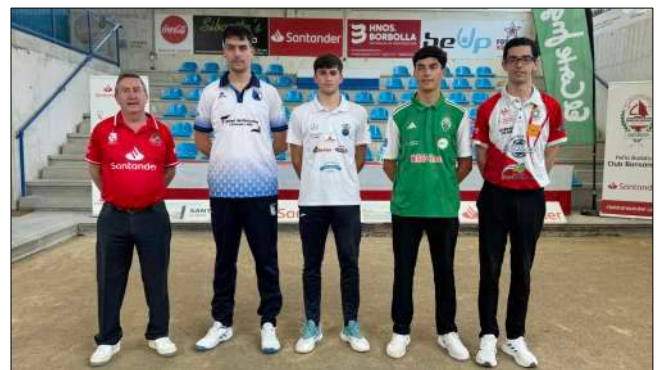
Finalistas del Torneo Rector 2024.