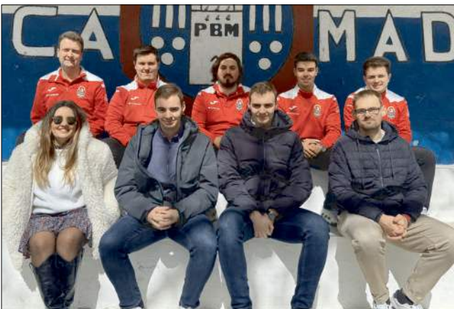
Jugadores y directivos en la bolera de Madrid.