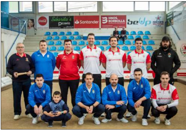
Encuentro amistoso con la Peña Bolística Gajano en la bolera Marcelino Ortíz Tercilla.