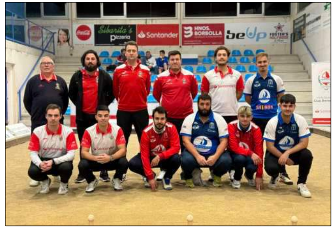
Foto de familia del partido amistoso con la P.B. Fernando Ateca (Santander).