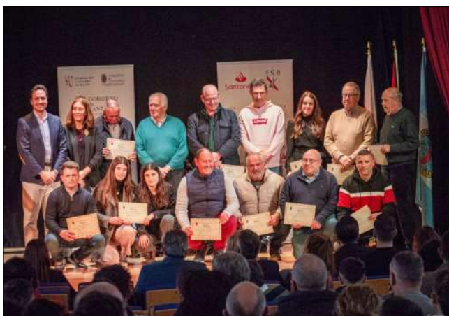
Foto de familia de los Campeonatos Regionales

La gala fue un punto de encuentro de la familia bolística y un momento de celebración para los éxitos obtenidos durante el año a los diferentes jugadores y peñas.