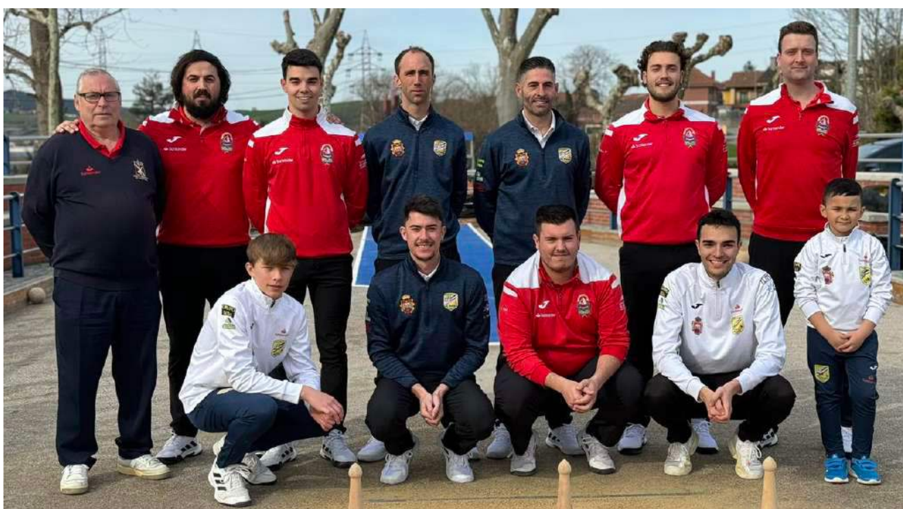
Foto de familia del amistoso con la Peña Bolística Los Remedios en la bolera "Muslera" de Guarnizo.

Estos amistosos serán una gran oportunidad para medir fuerzas y llegar en óptimas condiciones al inicio de la temporada.