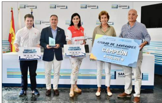
Presentación del cartel del nuevo concurso en el mes de abril.