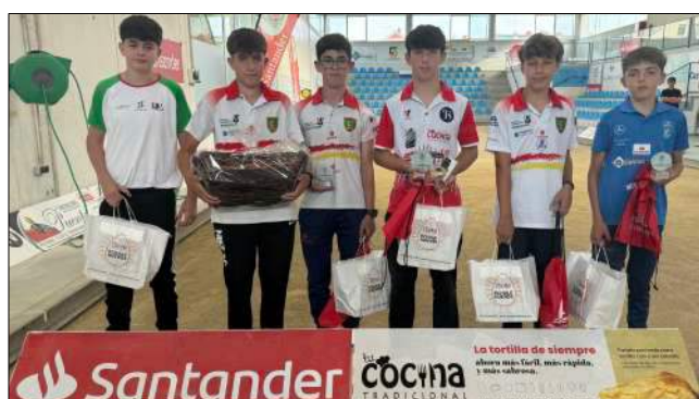
Entrega de premios de la categoría infantil.