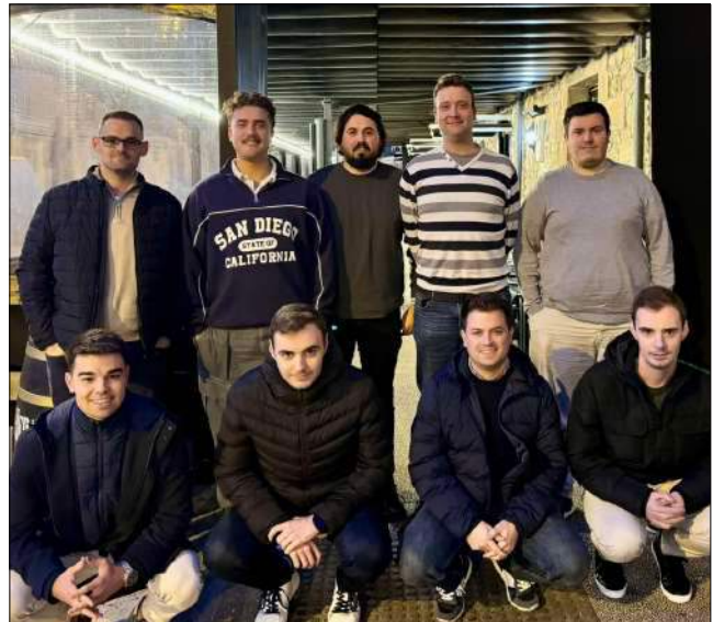
Asistentes a la comida de Navidad en Casa Sampedro (Torres).

Durante la comida, los seis jugadores del club aprovecharon para desear un próspero año nuevo y una exitosa temporada bolística. Además, se confirmó la fecha del primer entrenamiento del año. Con esta comida navideña, se prepara para arrancar la nueva temporada en la nueva categoría.