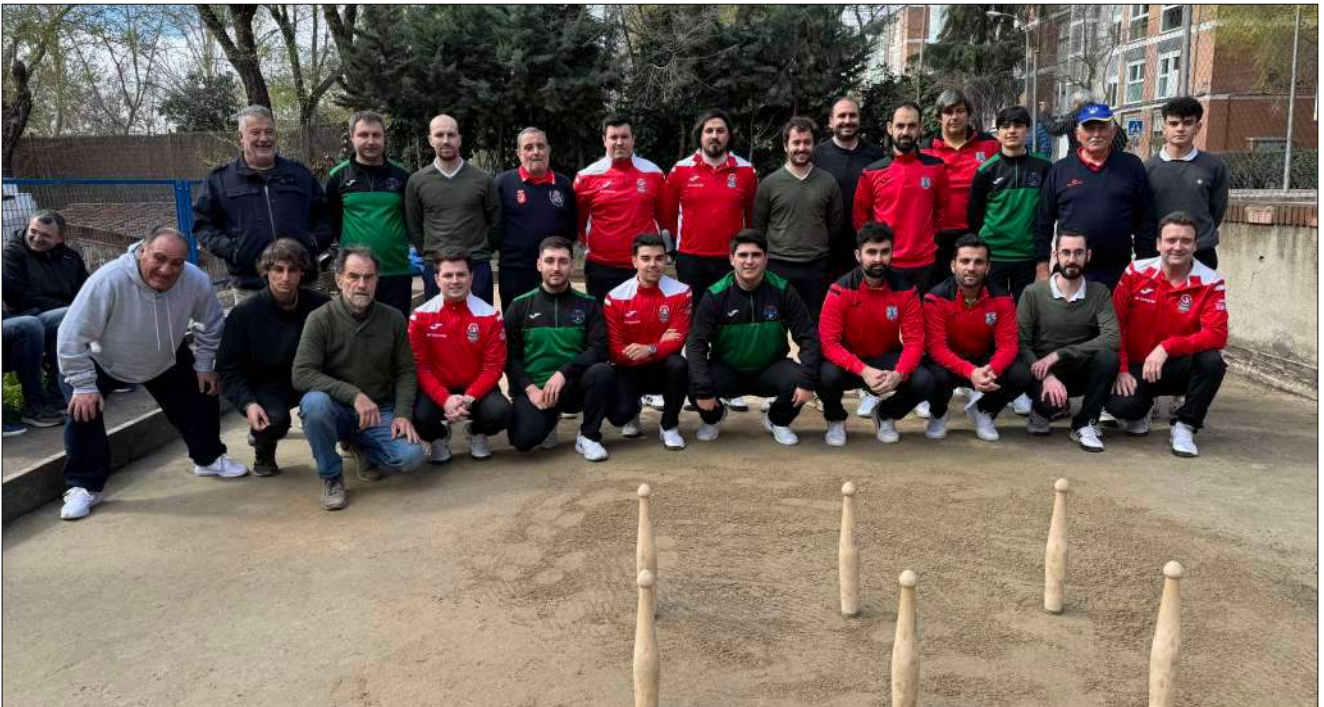
Foto de familia del Encuentro con las peñas invitadas.