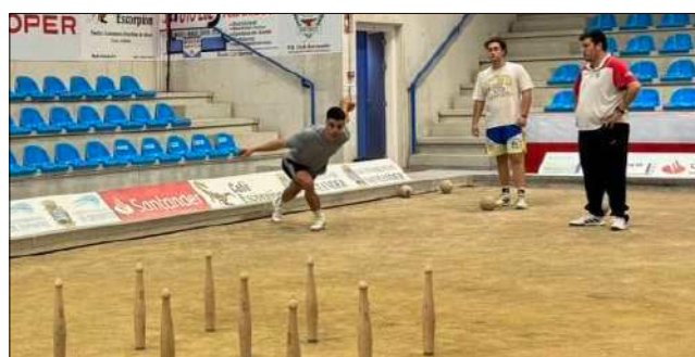
Primeros birles realizados en el entrenamiento del equipo.