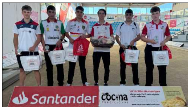
Entrega de premios de la categoría cadete.